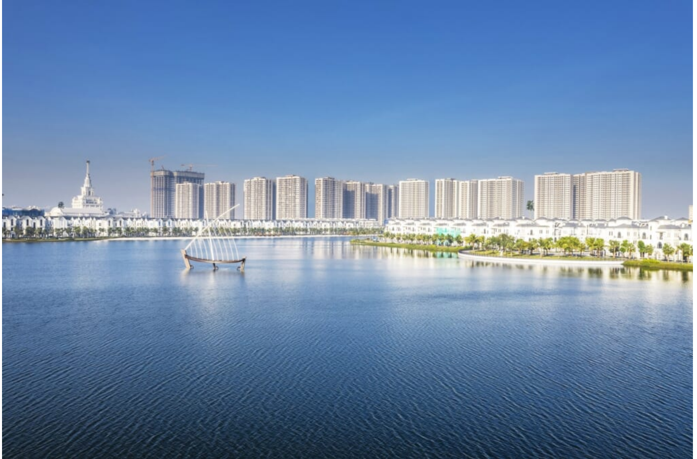
2. Dự Đà Nẵng Times Square - TP. Đà Nẵng

Long Giang Foundation không chỉ là một công ty xây dựng, mà là biểu tượng của sự kiên trì và tầm nhìn xa về việc kiến tạo cơ sở vững chắc cho tương lai. Với phương pháp thi công tiên tiến và đội ngũ chuyên gia hàng đầu Long Giang tự hào góp phần quan trọng vào việc xây dựng nền móng vững chắc cho nhiều công trình tầm cỡ, tạo cơ sở cho sự phát triển bền vững cho ngành công nghiệp xây dựng. Bên cạnh đó, Long Giang Foundation không ngừng đổi mới và áp dụng các phương pháp xây dựng tiên tiến nhất nhằm tối ưu hóa chất lượng và hiệu suất công việc. Bằng việc sử dụng công nghệ cọc khoan nhồi, tường trong đất Diaphragm, cọc Barette và sở hữu trang thiết bị hiện đại nhập khẩu từ các quốc gia hàng đầu, cam kết mang đến những giải pháp xây dựng đáng tin cậy nhất. Tinh thần và nhiệt huyết tiên phong kiến tạo nền móng được thể hiện qua nhiều công trình tầm cỡ, dưới đây là một vài dự án tiêu biểu: 1. Dự án Vinhomes Ocean Park - TP. Hà Nội