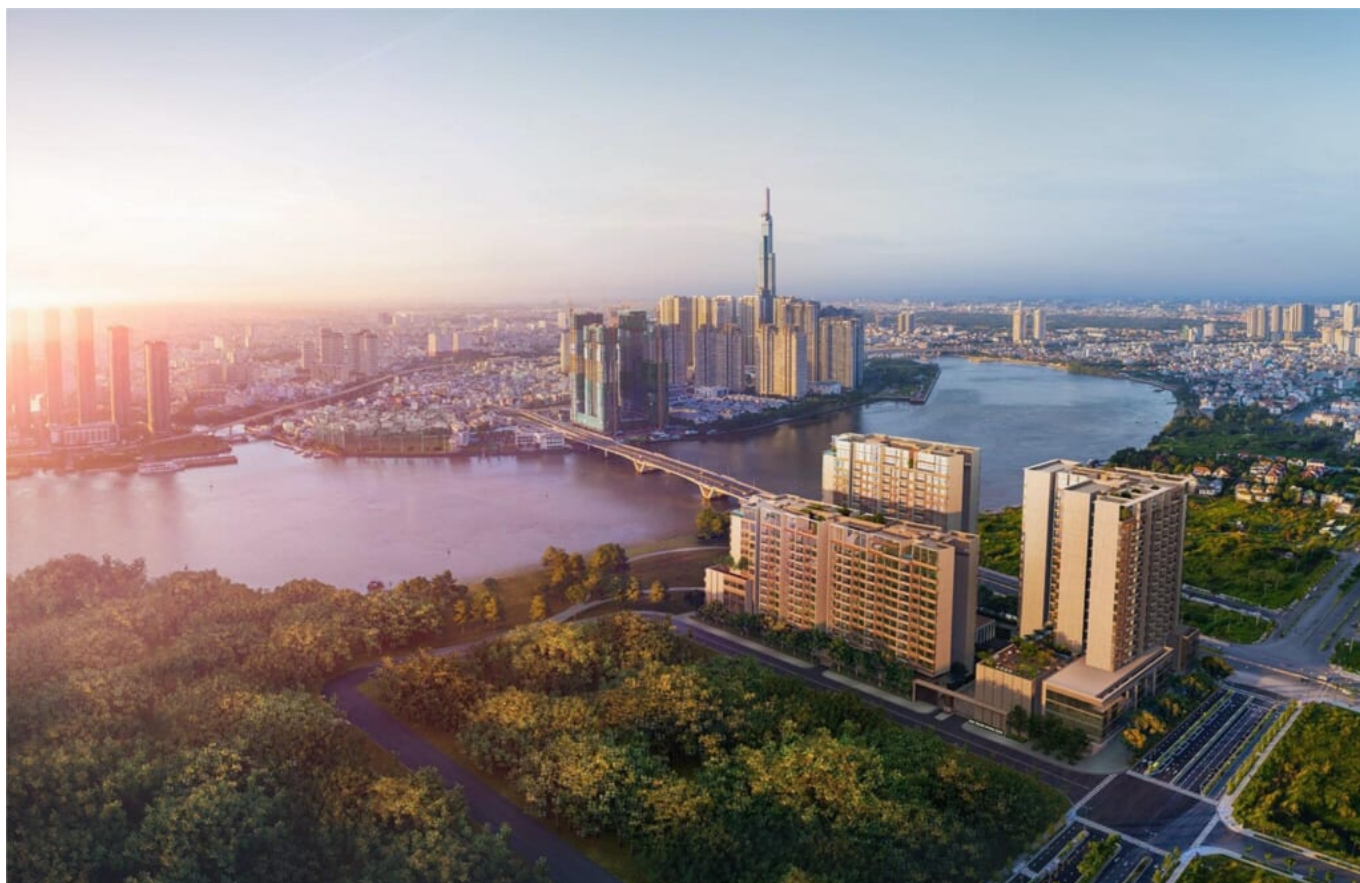
5. Dự án Estella Height Phase 2 - TP. HCM