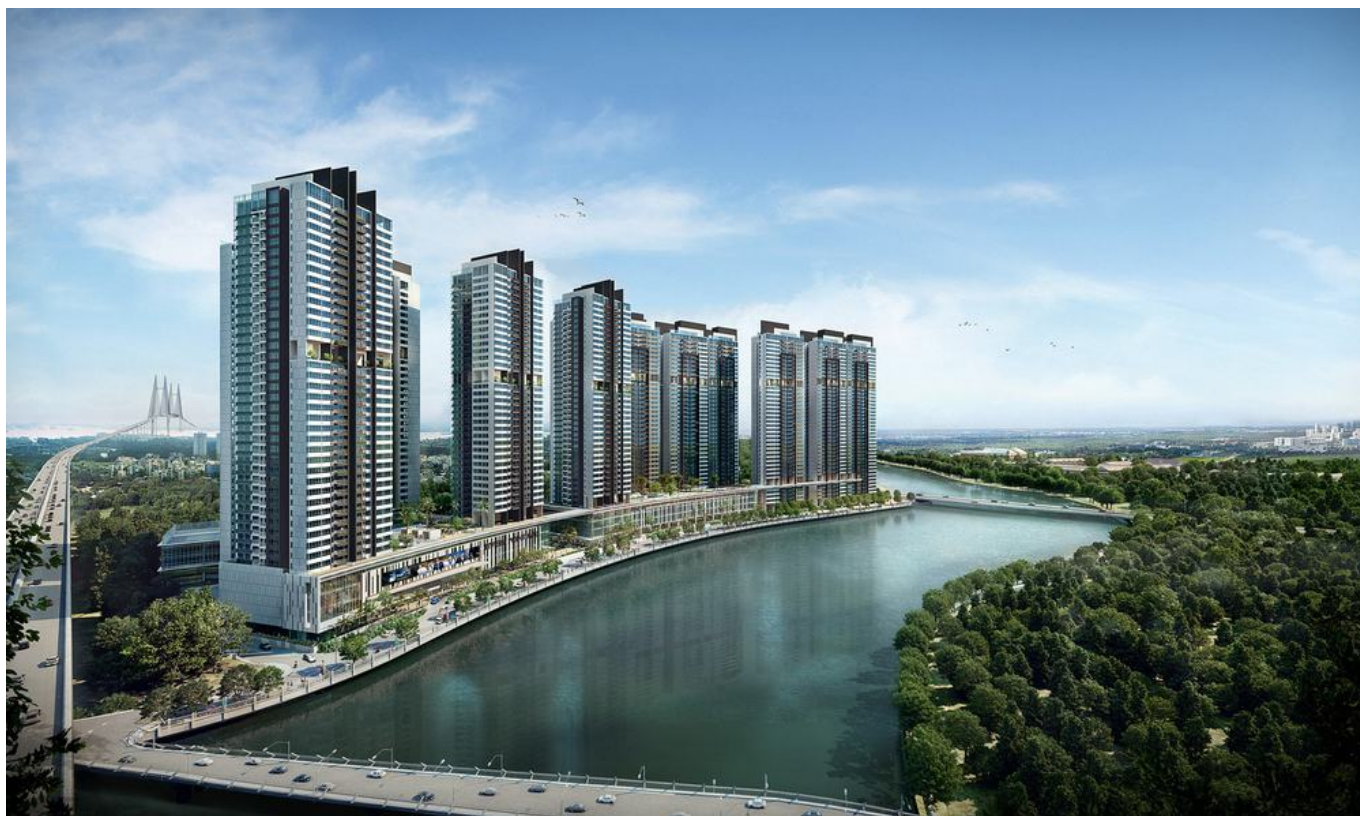
7. Dự án Vạn Xuân Happy One Central - Bình Dương