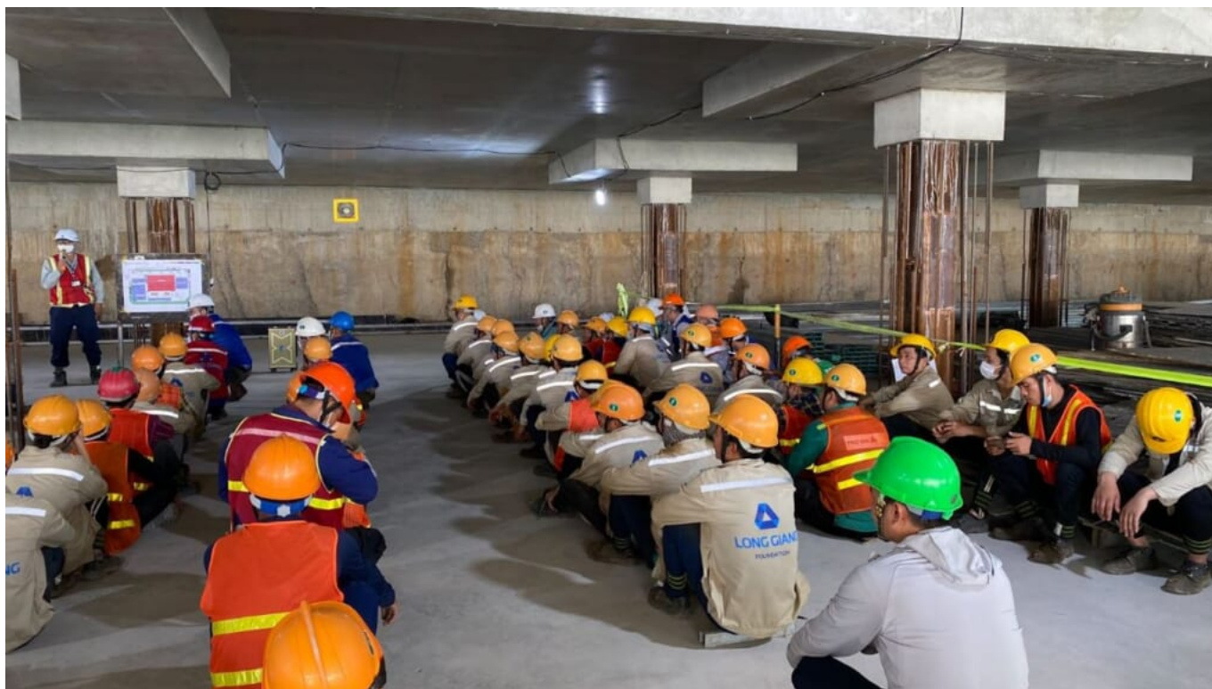
Nền móng Long Giang - Đặc biệt chú trọng tính chuyên nghiệp trong mọi hoạt động

Long Giang đã thể hiện sự chuyên nghiệp và kiến thức sâu rộng trong việc xây dựng nền móng và thi công tầng hầm cho dự án Taisei Square. Với tầm nhìn và tác phong làm việc chuyên nghiệp, của đội ngũ chuyên gia của Long Giang luôn đảm bảo rằng nền móng của dự án được xây dựng một cách vững chắc, sẵn sàng đối mặt với thách thức của thời gian và điều kiện địa chất khó khăn. Sự hiện diện của Long Giang đã mang lại niềm tin và yên tâm cho chủ đầu tư và toàn bộ dự án.